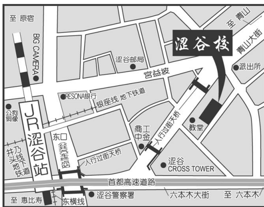
[ 涩谷校 ]