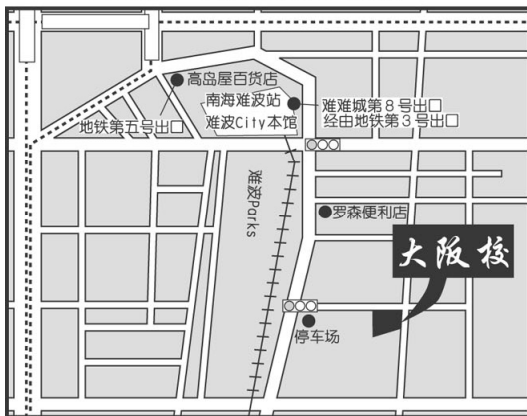
[ 大阪校 ]