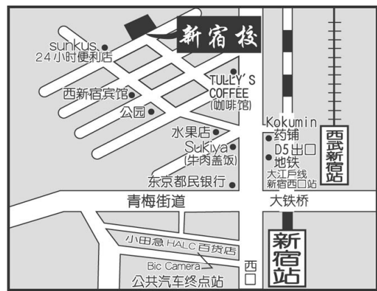
[ 新宿校 ]